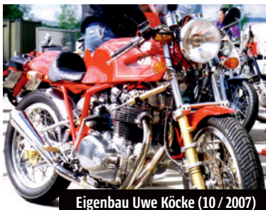
Eigenbau Uwe Köcke (10 / 2007)