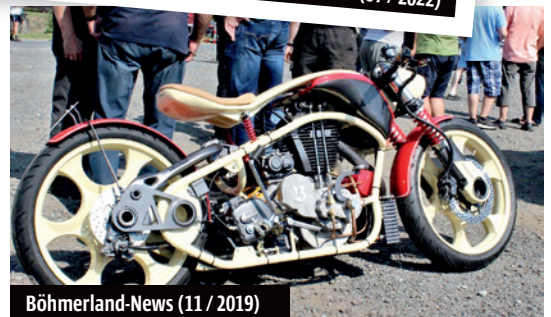
Böhmerland-News (11 / 2019)