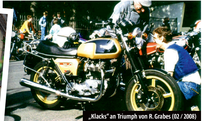
„Klacks“ an Triumph von R. Grabes (02 / 2008)

Es ist nicht alltäglich, dass über eine relativ lange Zeit eine Artikelserie von 200 Folgen zu speziell angepassten, fachlichen Inhalt von nur einem Autor in einer Fachzeitschrift erscheint. So bei TOP SPEED seit Heft 12 von 2006 bis Heft 09 / 2023.