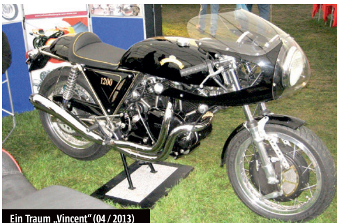
Ein Traum „Vincent“ (04 / 2013)