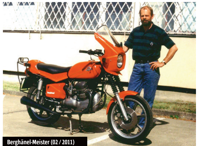
Berghänel-Meister (02 / 2011)

Möge den Lesern TOP SPEED noch sehr lange erhalten bleiben!