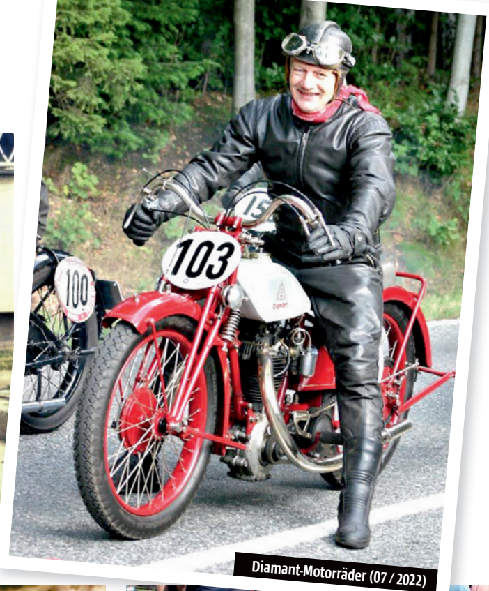
Diamant-Motorräder (07 / 2022)

ter. Unterdessen hatte sich ein großer, begeisterter Sammlerkreis stabilisiert. Der Ordner mit den Seiten der Artikel wurde immer dicker, nun, da das Ende immer näher rückt einmal den Umfang in Gewicht ausgedrückt sind das rund 3 kg mit insgesamt über 400 Seiten.