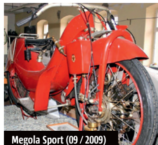
Megola Sport (09 / 2009)