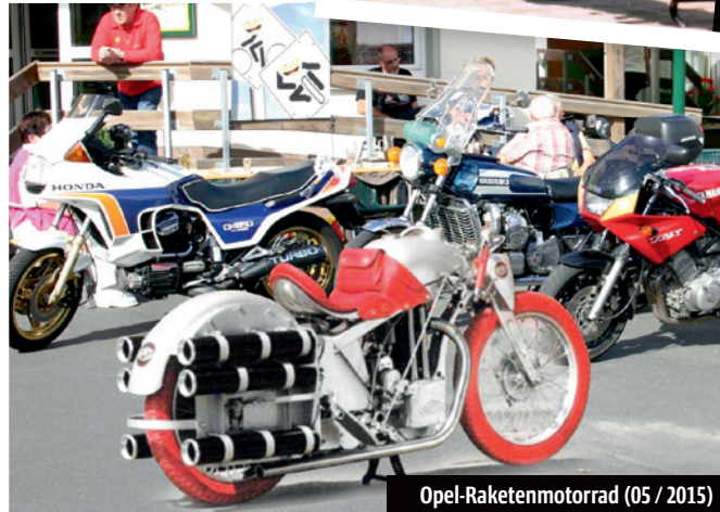
Opel-Raketennotorrad (05 / 2015)