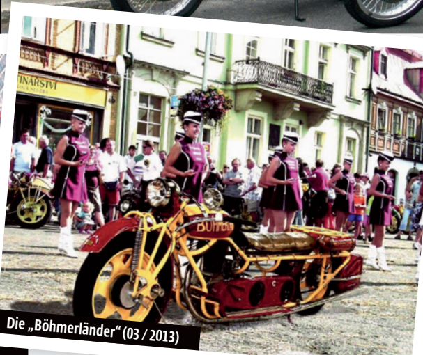
Die „Böhmerländer“ (03 / 2013)