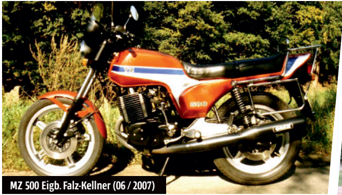
MZ 500 Eigb. Falz-Kellner (06 / 2007)