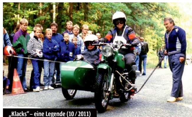
„Klacks“ – eine Legende (10 / 2011)