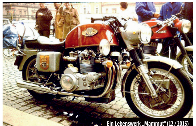
Ein Lebenswerk „Mammut“ (12 / 2015)