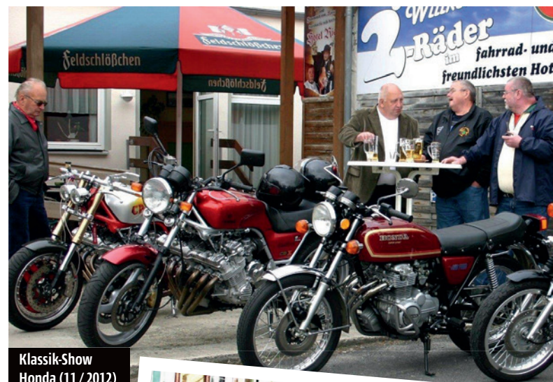
Klassik-Show Honda (11 / 2012)

ren und somit der Nachwelt zu erhalten. Die Arbeit begann, die „Kiste“ mit dem Sammeln der Dokumente wurde immer größer und der Zeitpunkt der Veröffentlichungen war da. Im Sommer 2006 wurde in einem Gespräch mit Verleger Hendrik Nöbel darüber beraten und er gab grünes Licht. Das Konzept war fertig auf 19 Folgen festgelegt. Im Dezember 2006 war die Premiere bei TOP SPEED, die Resonanz war sofort beachtlich positiv und die 19 Berichte waren schnell Geschichte. Schon zuvor kam von Lesern der ausdrückliche Wunsch „das darf nicht beendet werden“ und es ging wei-